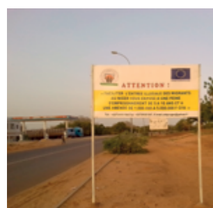
Campagne de sensibilisation sur l'application de la loi de 2015 relative au « trafic illicite de migrants », Niamey, juin 2017 Crédit photo : Bachir Ayouba Tinni, juin 2017

Classé parmi les pays les plus pauvres de la planète, bien que riche en ressources naturelles (notamment en uranium), et considéré comme stable depuis 2011, malgré l'insécurité dans la région, le Niger est un territoire facile d'accès pour l'Union, qui l'a déjà investi et y étend son influence : stratégie de sécurité et de développement pour le Sahel (2011), mission civile d'appui aux forces de sécurité intérieure et à la lutte contre le terrorisme et la criminalité organisée (EUCAP Sahel Niger, 2012), partenariat privilégié entre l'Union et le G5 Sahel, montants alloués au Niger par le Fonds fiduciaire (voir p. 3) mis en place au Sommet de la Valette (Malte, novembre 2015).