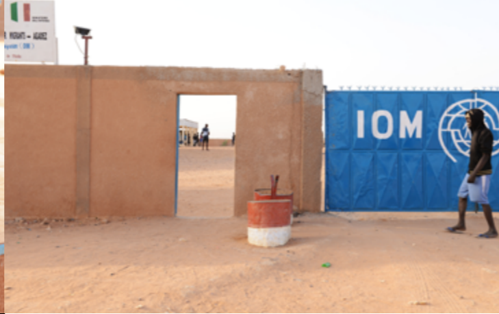
CENTRE DE TRANSIT DE L'OIM, AGADEZ (NIGER), MARS 2017