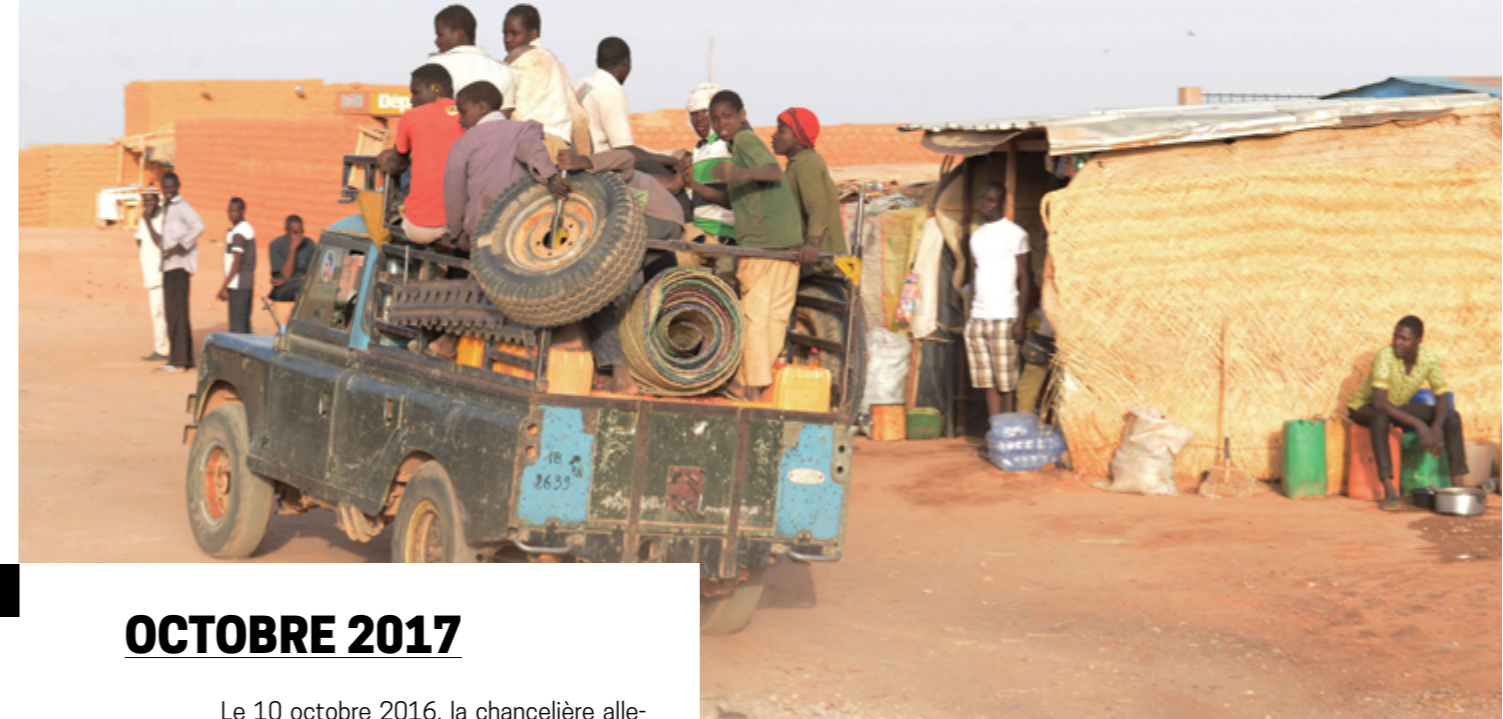
AGADEZ (NIGER), MARS 2017

Ce projet a été soutenu par le Programme européen pour l'Intégration et la Migration (EPIM), une initiative collaborative du Réseau des Fondations européennes (NEF)