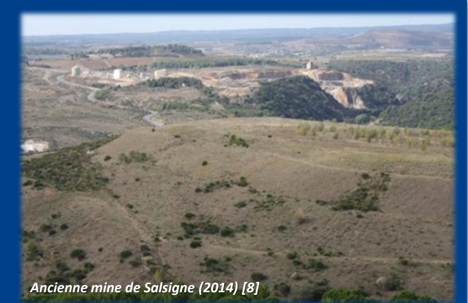
Ancienne mine de Salsigne (2014) [8]

Salsigne, l'ancienne plus grande mine d'or française, fut aussi le premier producteur mondial d'arsenic, utilisé pour la fabrication du verre, mais aussi pour les gaz de combat. La pollution est omniprésente : sous terre, dans l'air et dans l'eau. En cause : les produits chimiques utilisés pour transformer le minerai aurifère, et l'arsenic, présent sous la forme de poussières, très fines, dans le sous-sol. Des poussières à travers lesquelles les eaux ruissellent avant de se jeter dans l'Orbiel,