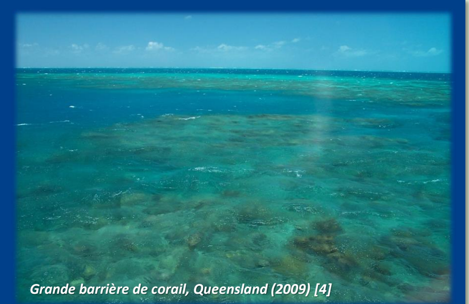
Grande barrière de corail, Queensland (2009) [4]

Le projet Alpha Coal visant à exporter 30 millions de tonnes de charbon par an pendant 30 ans vers les marchés asiatiques, aurait de très nombreux impacts environnementaux. Cette gigantesque mine composée de 6 mines à ciel ouvert défricherait 22 500 hectares de végétation endémique. La zone est reconnue pour la richesse de sa biodiversité composée de plus d'une centaine d'espèces, notamment des wallaby, des kangourous et des koalas.