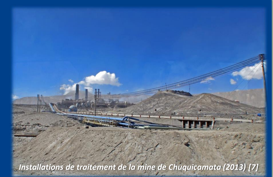
Installations de traitement de la mine de Chuquibambuta (2013) [7]

La production minière du Chili a augmenté de 265% entre 1990 et 2005. L'industrie minière reste la première responsable des émissions de dioxyde de soufre au Chili et des émissions d'arsenic dans plusieurs régions. En 2005, les émissions de SO 2 des grandes mines s'élevaient cependant à moins d'un tiers de leur niveau de 1991 ; les fonderies de cuivre entrant toujours pour 76% du total des rejets chiliens. Bien que des efforts aient été menés, notamment par