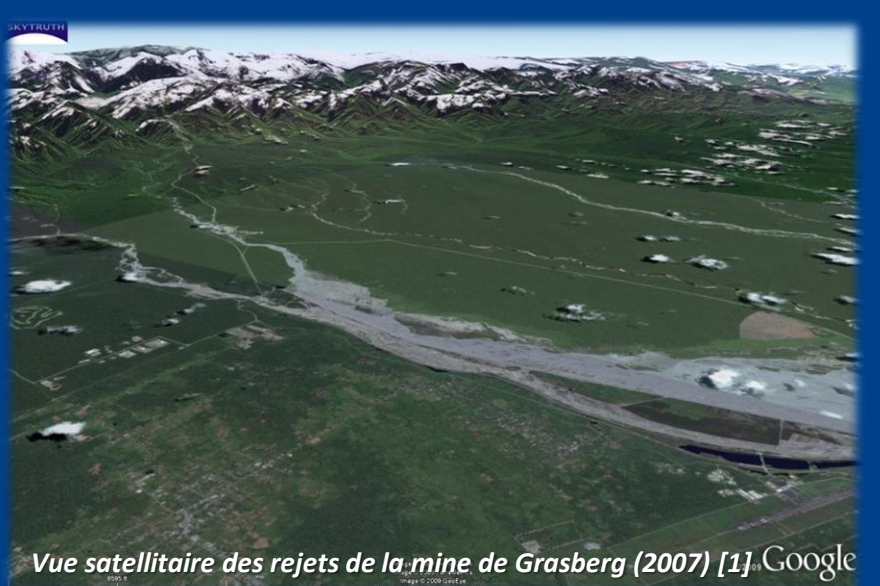
Vue satellitaire des rejets de la mine de Grasberg (2007) [1].

Au début de l'exploitation, dans les années 1960, Freeport-Mc-Moran rejetait depuis son site minier situé à 4000 m d'altitude, 125 000 tonnes de résidus miniers par jour dans les rivières. En 1998, 300 000 tonnes de ces déchets potentiellement toxiques étaient déversés quotidiennement. Pollution à laquelle s'ajoutent les rivières d'eaux acides issues de la mine. Dans les terres basses, plus de 100 km 2 d'une forêt primaire qui compte encore parmi les mieux préservées au monde, auraient