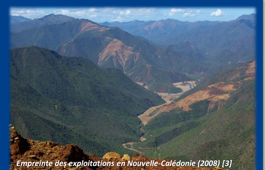
Empreinte des exploitations en Nouvelle-Calédonie (2008) [3]

Jusqu'au milieu des années 1970, faute de réglementation, les compagnies minières brûlaient la végétation lors de leurs opérations de prospection et déviaient systématiquement les résidus en aval. Or, la flore néo-calédonienne se caractérise par un taux d'endémicité exceptionnellement élevé : les deux tiers des espèces de la zone sont endémiques. La concentration d'une si grande diversité d'espèces sur une si petite surface est une source de grande