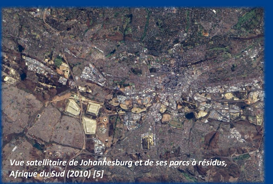
Vue satellitaire de Johannesburg et de ses parcs à résidus, Afrique du Sud (2010) [5]

Le bassin minier du Witwatersrand comporte de très nombreuses exploitations d'or et d'uranium (principalement) qui ont donné lieu à l'installation de plusieurs centaines de parcs à résidus non confinés. Ces dépôts miniers s'étendent sur une surface totale de 400 à 500 km 2 . Certains d'entre eux présentent une surface de 10 km 2 et une hauteur de plus de 100 m. Ces installations n'ont fait l'objet d'aucun confinement et ont été abandonnées en l'état. Il en résulte un lessivage et