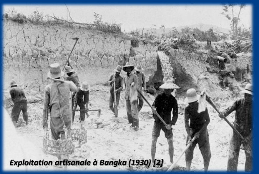
Exploitation artisanale à Bangka (1930) [2]

L'exploitation des mines d'étain sur l'île de Bangka a de lourds impacts environnementaux et sociaux. Exploitée depuis le 18 ème siècle, l'île a cependant connu une intensification des exploitations, en particulier illégales, suite à un changement législatif en 1999. L'emprise des exploitations alluvionnaires serait de 5 000 hectares. Les sols et les lits des cours d'eau sont profondément remaniés puis laissés à l'abandon ; empêchant le développement ultérieur de la végétation.